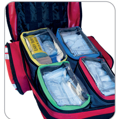
Profi-Like Modultaschen aus dem Profi-Rucksack ultraRESCUE I