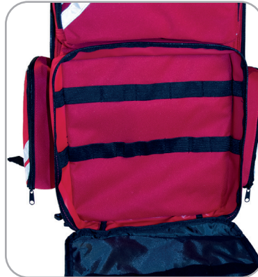
Ordnungssysteme in allen Taschen