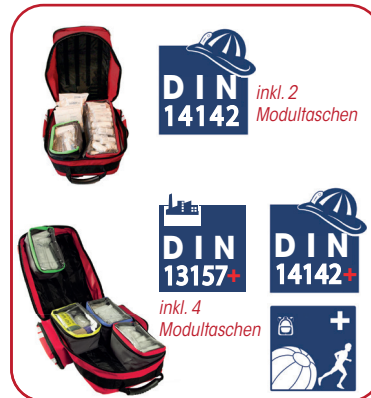
4 Varianten inkl. Füllung Betrieb, Helfer vor Ort, Feuerwehr und Sport