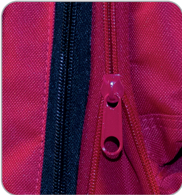
Farbliche Kennzeichnung Erweiterung - Roter Reissverschluss