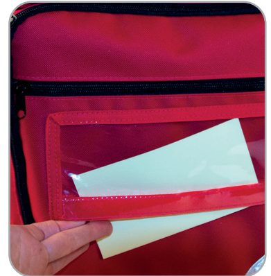
Kennzeichnungsfenster Öffnung nach unten zum Schutz vom Spritzwasser